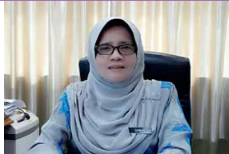
REKTOR INSTITUT PENDIDIKAN GURU MALAYSIA